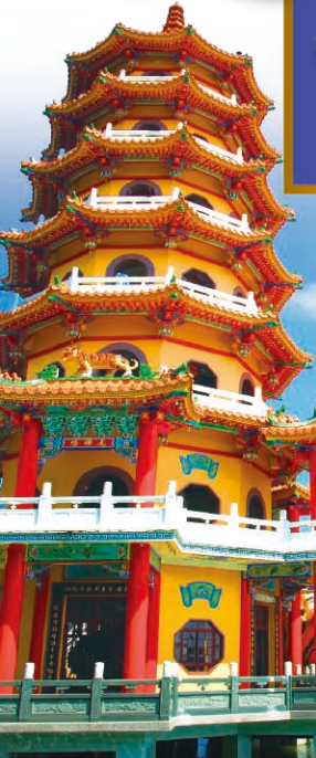
龍虎塔 (イメージ) ※蓮池潭の「龍虎塔」は現在改修工事のため、外観がカバーで覆われている場合がございます。